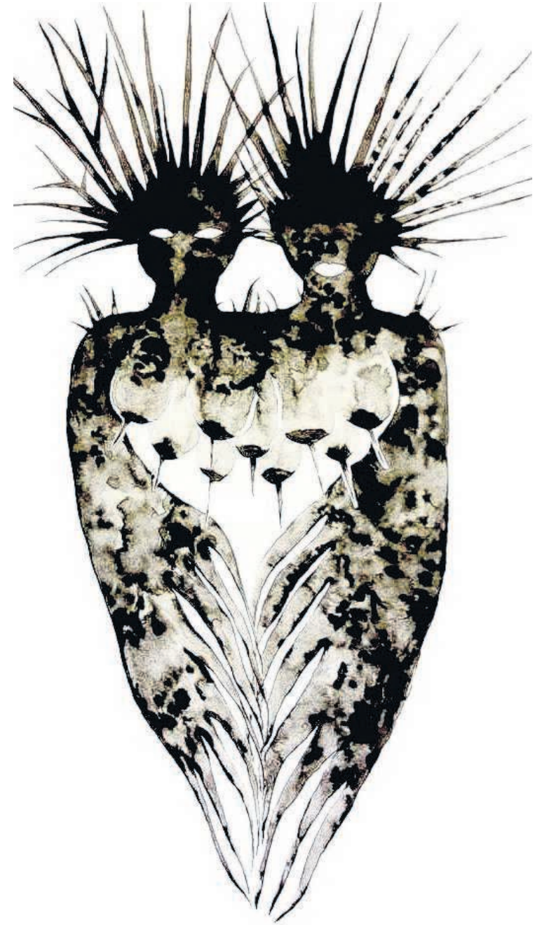
Manman Chadwon to ManmanChadwon.

Volgens Gambie is het residency-programma een geweldige kans voor haar om andere Caribische kunstenaars te ontmoeten, gedachten uit te wisselen en contact te maken. "Ik wil het bijzondere landschap van Aruba ontdekken en me daardoor laten inspireren. Elk residency-programma is een manier om steeds