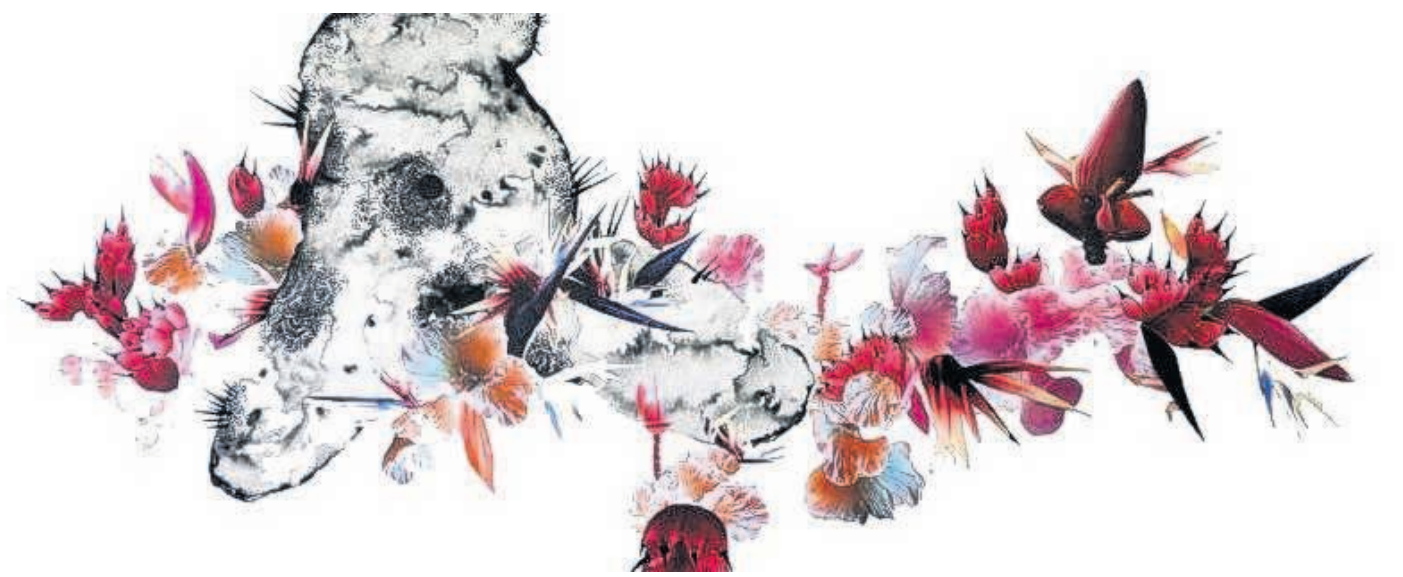
'The Fantastic Ride'.